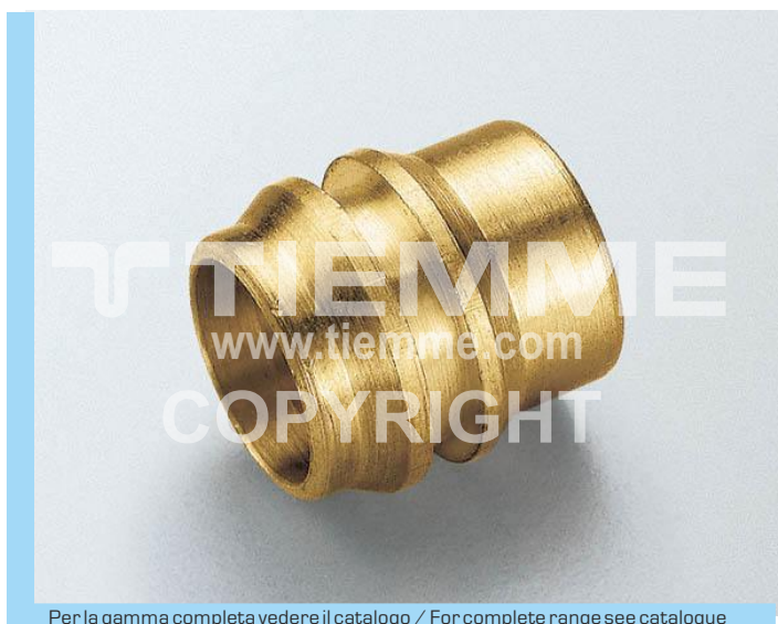
Per la gamma completa vedere il catalogo / For complete range see catalogue

Reducing bush art. 1147G is suitable only for copper pipes or calibrated steel pipes; for any other application please contact our Technical Service. The bush must be lubricated with potable oil or grease in order to allow a more uniform strain and also to obtain an easier assembling.